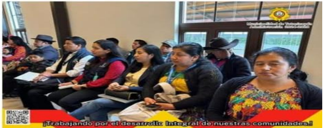
Trabajando por el desarrollo Integral de nuestras comunidades!