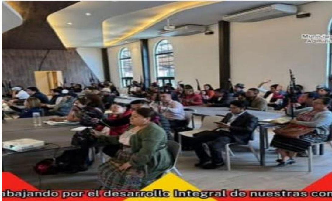
Trabajando por el desarrollo Integral de nuestras comunidades!