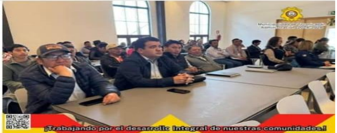
Trabajando por el desarrollo Integral de nuestras comunidades!