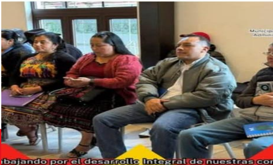
Trabajando por el desarrollo Integral de nuestras comunidades!